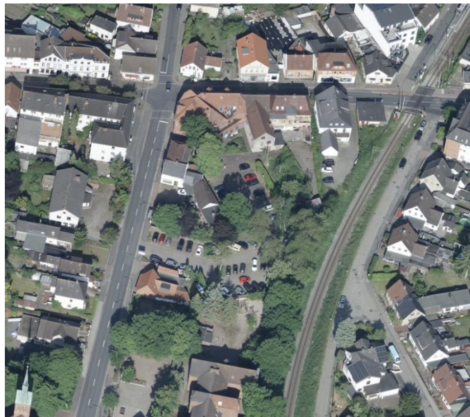
Luftbild vom Plangebiet