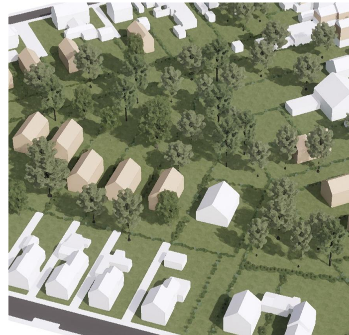
Beispiel für mögliche Bebauung

Es ist ausdrücklich erwünscht, dass Sie ihre Meinung in den Planprozess aktiv einbringen. Die Planung wird danach überarbeitet und Sie werden sich in einem zweiten Beteiligungsschritt zu den überarbeiteten Plänen äußern können.