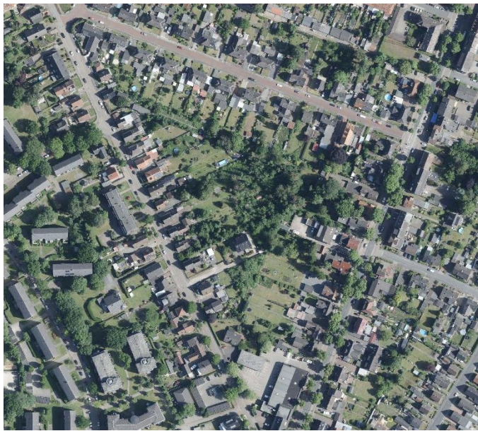
Luftbild vom Plangebiet