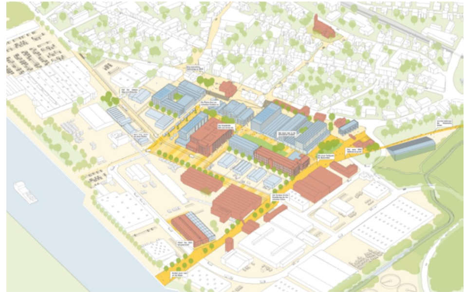
Strukturkonzept, De Zwarte Hond